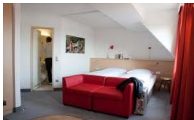
中央駅まで徒歩圏内の4つ星ホテル