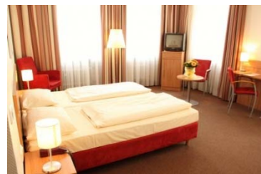
中央駅まで徒歩圏内の3つ星ホテル

※欧州のホテルは、ツインルームに対してシングルルームの場合、広さや設備的に劣る場合がございます。シャワーのみの部屋もありますのでご了承ください。